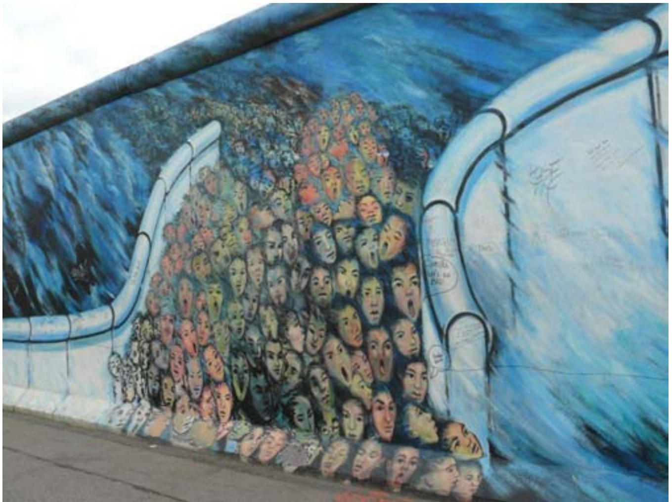
Artist Impression op de Restanten van de Muur