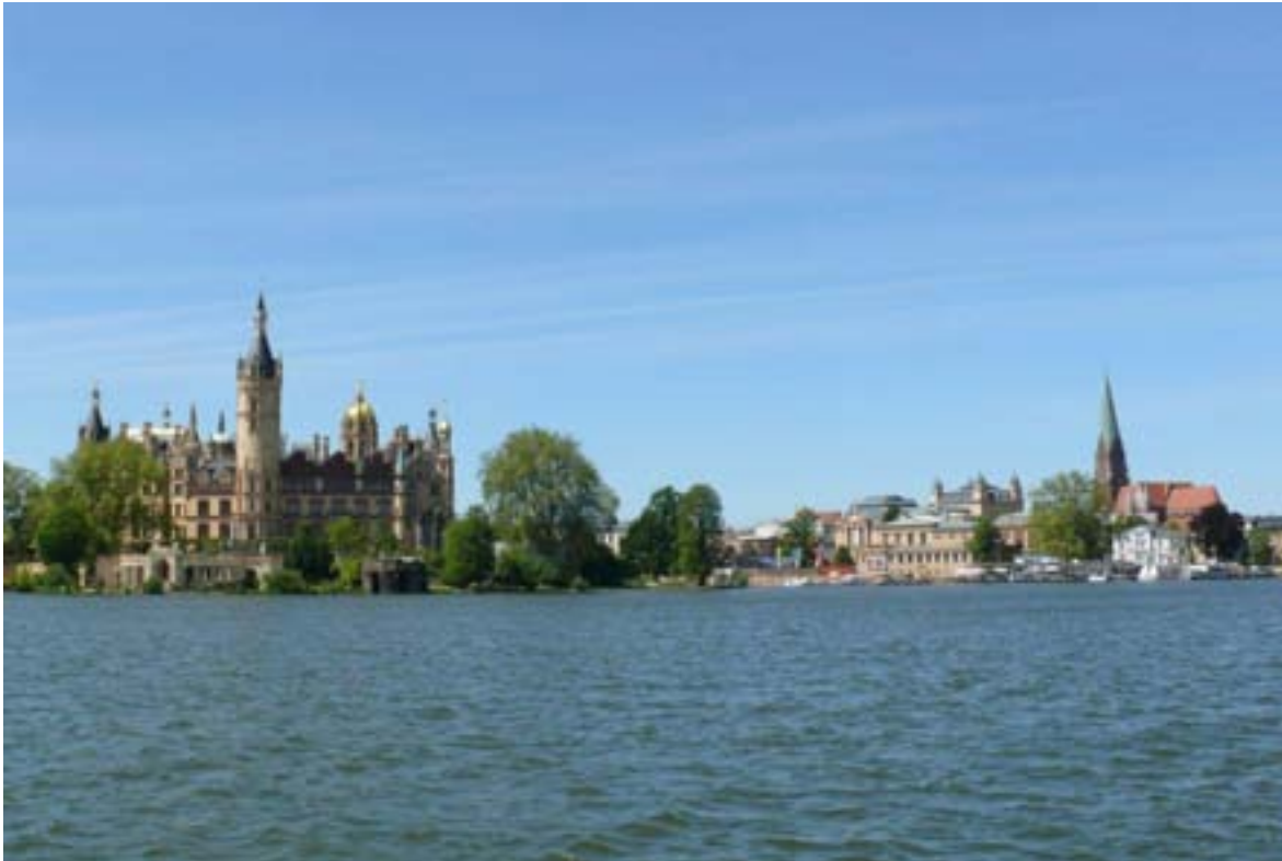
Het aanzicht van Schwerin