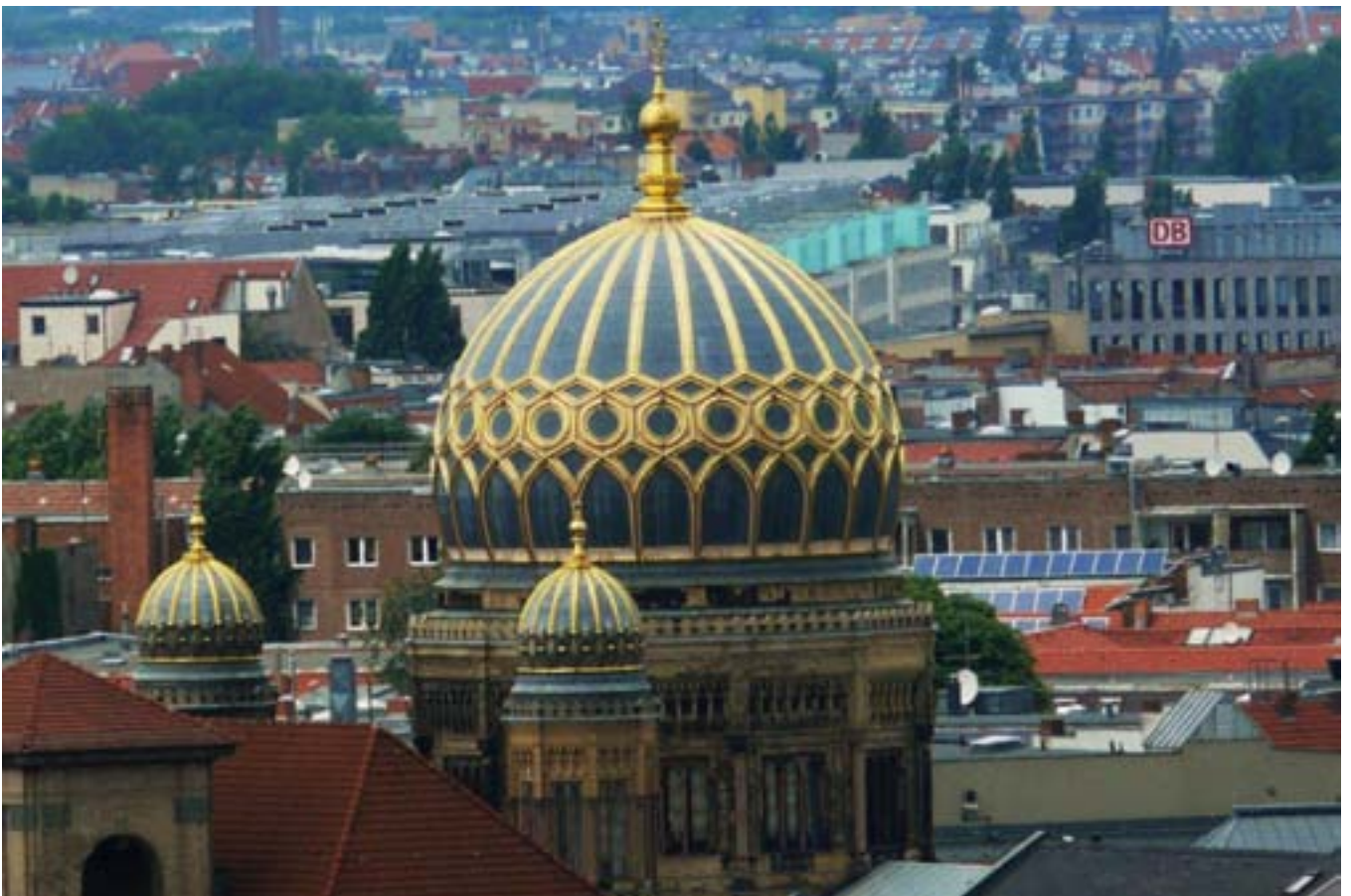
Neue Synagoge vanaf Berliner Dom