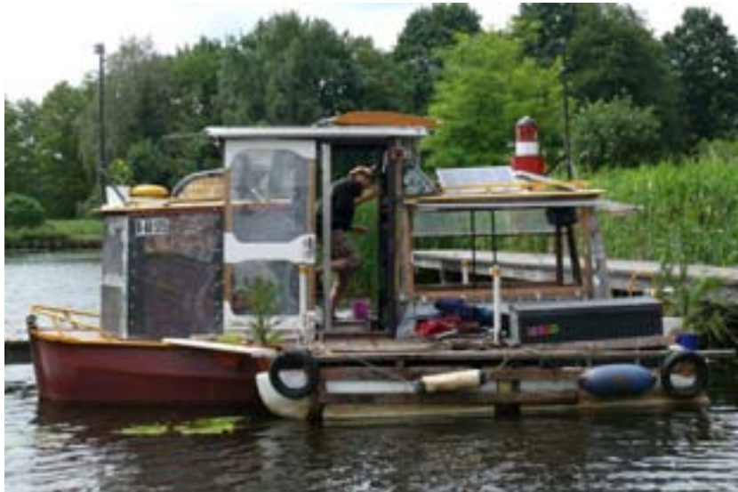
Afdeling vreemde vaartuigen