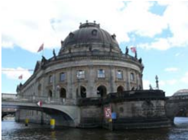
Museum Insel met Bode museum.