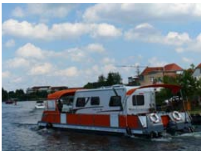
Caravan / camper boot.

Daarna is alles goed gegaan want enkele dagen later kwamen we ze weer tegen en ze gaven 2 duimen omhoog.