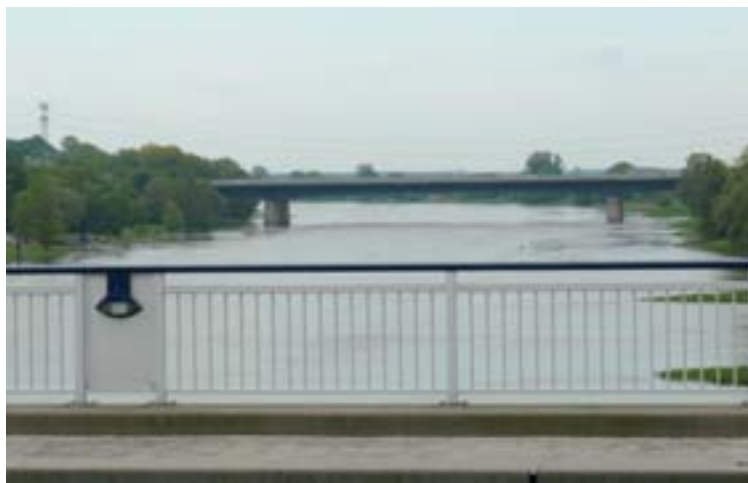
Kruising Mittellandkanal met Elbe, Stroomafwaarts en stroomopwaarts.

Door de regenval van de laatste weken is de waterstand in de Elbe hoger dan normaal in deze tijd van het jaar. Fietspaden langs de oever zijn op verschillende plaatsen niet toegankelijk vanwege te hoge waterstand.