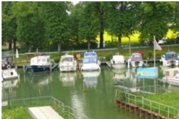
Jachthaven Bad Essen, invaart vanaf MLK