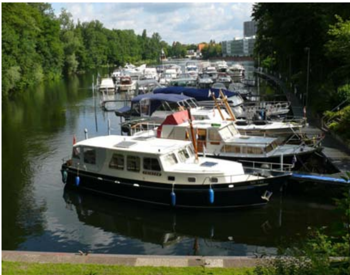
Ligplaats aan de Tegeler See bij Motor Yacht Club Tegel.

Bovendien was er een reductie bij een verblijf van een maand waardoor de kosten per maand op 195 Euro kwamen. Of we een maand blijven of 3 weken in elk geval een goede plek en een zeer attente havenmeester. HOW kp 4 tot aan de afslag naar de Tegeler See.