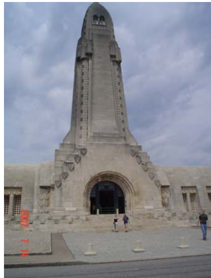
Oorlogsmonument in Verdun