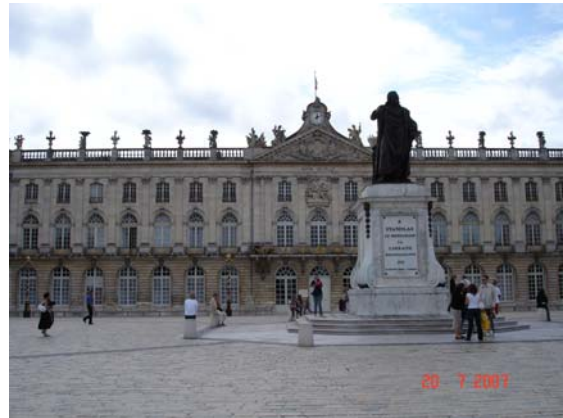
Het Stanislawplein in Nancy