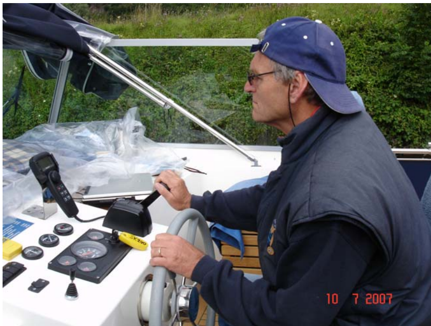
Schipper vlak voor de ingang van de tunnel in de regen.

Het verkeer in het tunneltje wordt geregeld door de sluismeesters van de sluisen voor en na de tunnel. Dit was één van die zeldzame keren dat we sprayhood lieten zakken om onder de 3,50 doorvaarthoogte te komen en natuurlijk regende het.