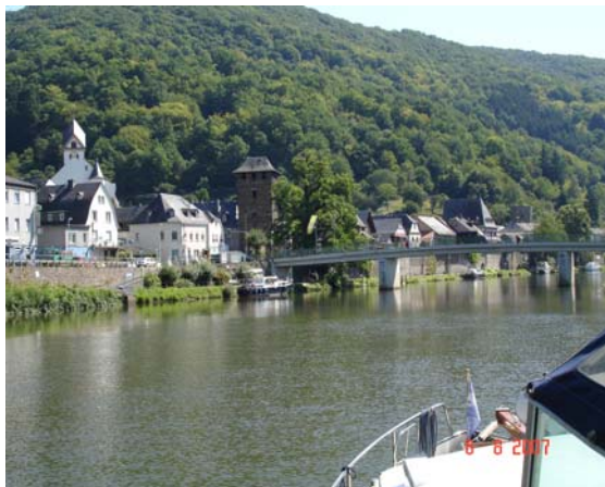
Een van de oudste stadjes aan de Lahn

De Lahn is een lieflijk riviertje met 9 sluisjes, die sterk doen denken aan de Franse sluisen. De bediening is vlot. Het vinden van een goede ligplaats is soms niet zo gemakkelijk omdat je met 12 meter redelijk `groot` bent op dit vaarwater. Maar het ons toch altijd gelukt. In Bad Ems is vlak na de sluis in het zeer smalle omleidingskanaaltje een goede jachthaven, maar wij verkozen even verderop in Bad Ems een plaats aan een steigertje dat ongeveer 3 meter de rivier in stak en 1 meter breed was.