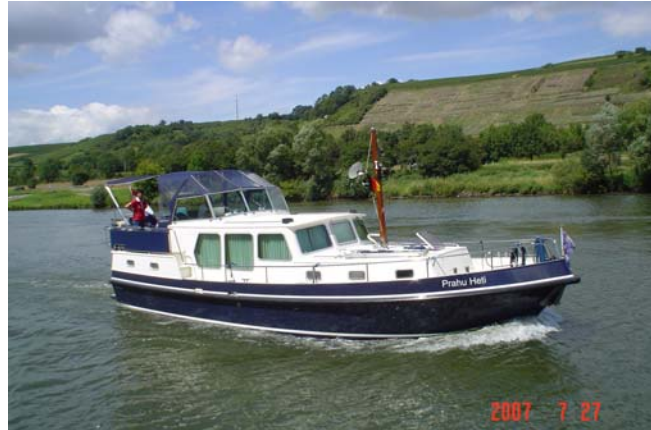
Prahú Heti op de Franse Maas

De omleidingskanalen naar de sluizen worden naarmate wij dichterbij de oorsprong van de Maas komen, steeds langer. Het is iedere keer weer een belevenis na een kanaal de echte Maas weer te bevaren. De kanalen zijn namelijk erg smal en we zijn dan ook blij geen Spits tegen te komen.