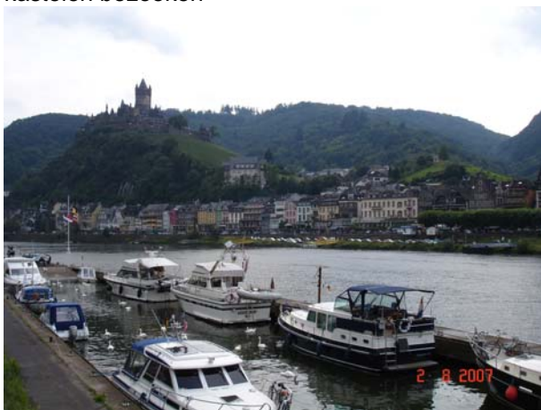
Ligplaatsen in Cochem

Na Luxemburg kwamen wij in Duitsland en de eerste grote stad is Trier. Wederom een stad die de moeite waard is om uitgebreid te bekijken. We hebben nog even een uitstapje met de boot gemaakt naar Saarburg aan de Saar, eigenlijk om te kijken wat voor soort rivier de Saar is. Conclusie: bij een volgende reis zal zeker ook de Saar bevaren worden. Ietsje smaller dan de Moezel, maar zeker zo mooi en Saarburg is een bezoekje waard. Vervolgens weer terug naar de Moezel. Het gedeelte tot vlak na Cochem is werkelijk magnifiek. Het is als zo vaak, van het water gezien veel mooier dan op het land. De plaatsjes zijn wel erg toeristisch, maar is dat gek? Wie van klimmen houdt kan veel mooie kastelen bezoeken