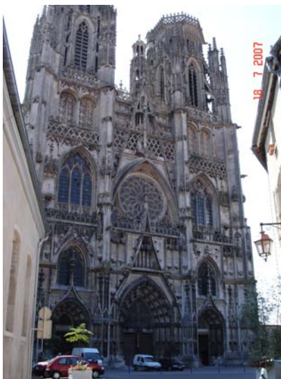
Katedraal van Toul

Uiteindelijk komen we na een schitterende tocht bij het tunneltje van Foug, slechts 450 meter lang en goed verlicht. Hier nemen we afscheid van de Maas die verder onbevaarbaar is. Foug verbindt de Maas met het kanaal "de la Marne au Rhin". Na het steeds maar stroomopwaarts varen begint nu het stroomafwaarts varen naar de Moesel. Een korte tocht brengt ons naar Toul, wederom een stad die de moeite waard is om een dagje te blijven liggen. Opvallend is het glasheldere water in de drukke stadsjachthaven, waar overigens altijd voldoende plaats schijnt te zijn. Nu mag gezegd worden dat het water ook in de Franse Maas al bijna on-Frans schoon en helder was. We zijn ook nauwelijks industrie tegengekomen, behalve een paar cementfabrieken. Herhaaldelijk hebben we dan ook gezwommen. Dat is in de meeste andere kanalen in het Noorden wel anders. Ook in ons land.