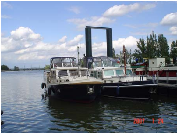
De niet zo plezierige aanlegsteiger in Thionville

Even na Thionville verlaten wij Frankrijk en komen in Luxemburg. De Maas is hier de scheidingsrivier tussen Luxemburg en Duitsland. Luxemburg is vriendelijk en heuvelachtig, heel anders dan het landschap voor Thionville en Na Trier. Omdat het zo vriendelijk en uitnodigend is, hebben wij twee dagen doorgebracht in Schwebsange met haar schitterende Dreiländer Yachthafen. We hebben de omgeving uitgebreid verkend en zijn o.a. in Schengen geweest, waar het ook voor Nederland zo belangrijke verdrag getekend is, waardoor wij binnen de Schengen Groep in ieder geval nergens meer ons paspoort hoeven te laten zien.