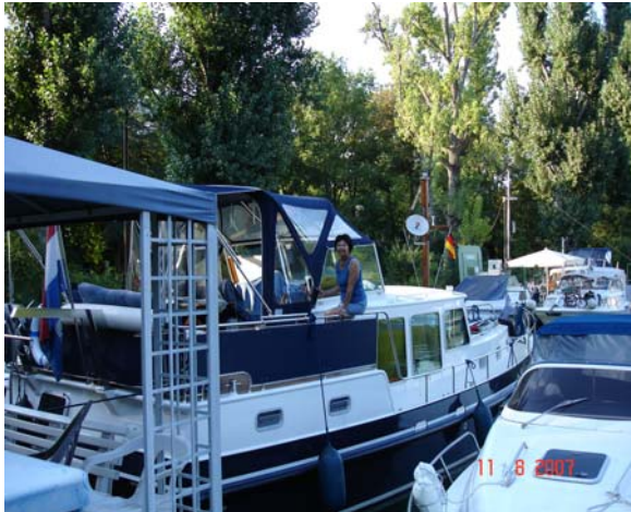
Koblenz, drijvende steigers in

Wij besloten maar te gaan varen, want we konden niet meer met droge voeten aan de wal komen vanaf onze drijvende steiger.