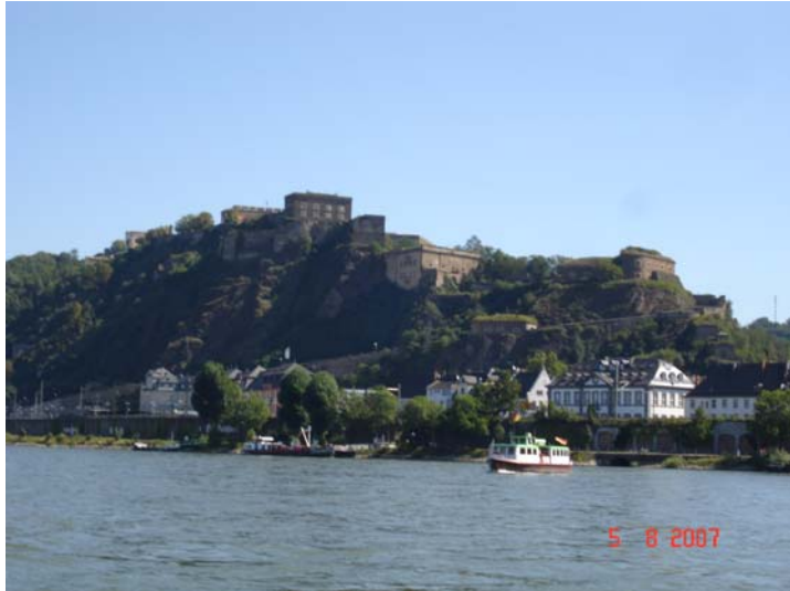
Rijn bij Lahnstein de plek waar de Lahn

Op de Rijn krijgen we 7 km stroom tegen, en zetten dus maar even een tandje bij om toch wat vaart te maken. Hier kom ik tot de conclusie, dat mijn stelling, dat je met een verdringer (Zoals de SK) de Rijn alleen maar af en nooit op moet varen, in mijn ogen nog steeds juist is.