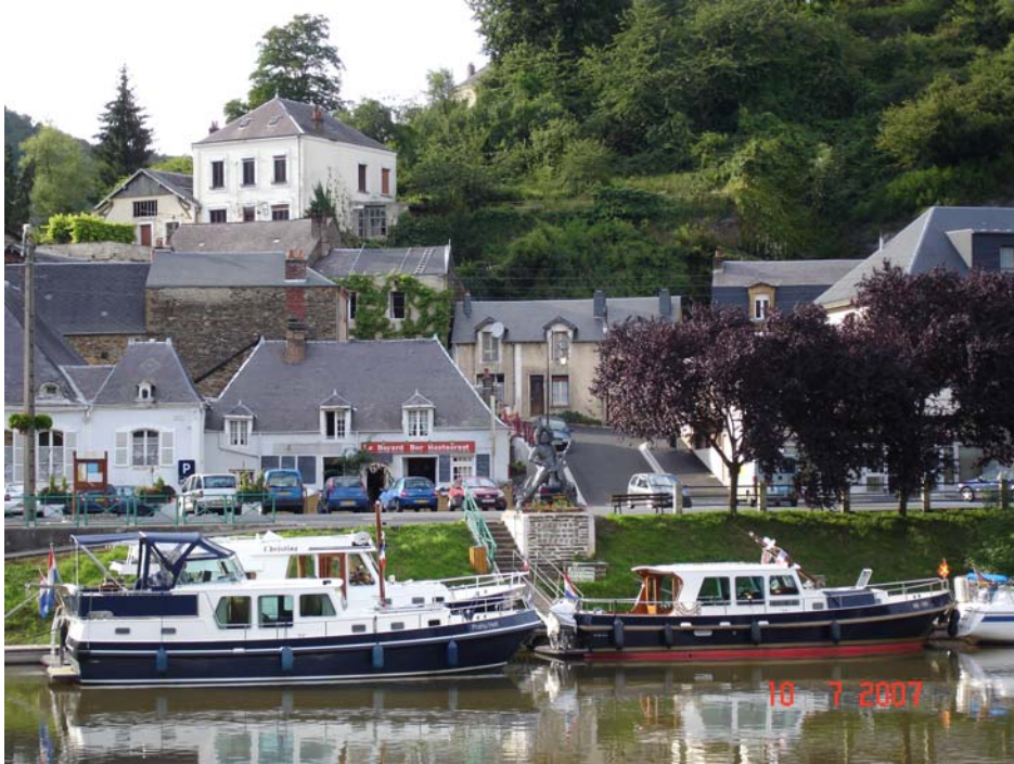
De SK240 ontmoet de SK 240 (Prahú Heti) en SK196 in Halte de Château Regnault. Een OK en een AK van 12 meter.

Naarmate we zuidelijker komen wordt het weer eindelijk beter, hoewel de barometer vastgeroest lijkt op 990. Later blijken we gewoon geluk gehad te hebben. We zaten constant in het centrum van een depressie tussen twee regengebieden in.