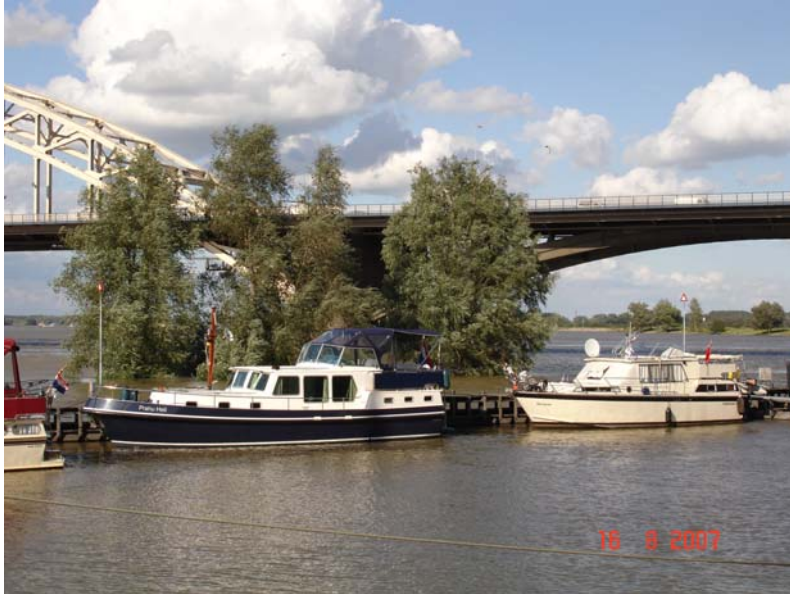
Nijmegen, de jachthaven lag nu