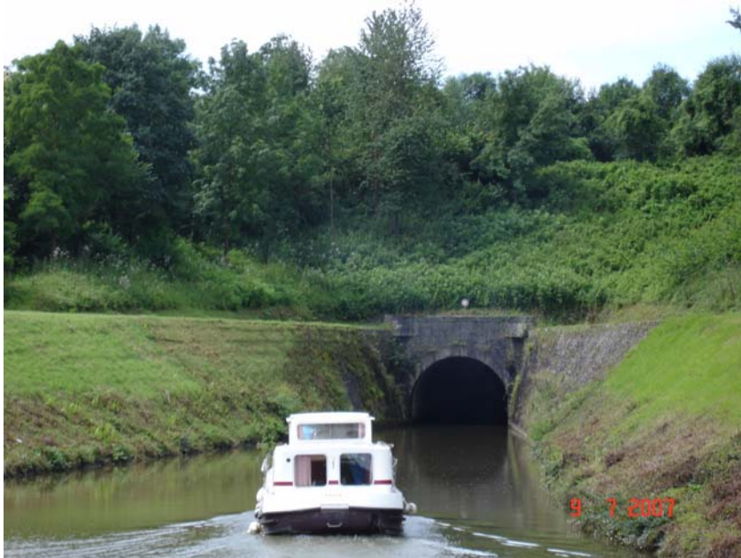
ingang van het onverlichte tunneltje van Ham

Het verkeer in het tunneltje wordt geregeld door de sluismeesters van de sluisen voor en na de tunnel. Dit was één van die zeldzame keren dat we sprayhood lieten zakken om onder de 3,50 doorvaarthoogte te komen en natuurlijk regende het.