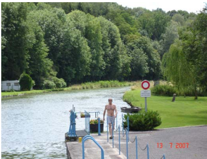
na een handje helpen

In de zomer worden in Frankrijk veel festiviteiten georganiseerd zoals een enorme vuurwerkshow in Verdun op de 14 e juli. De sluisjes, 56 totaal in de Maas, gaan merendeels automatisch en dat werkt perfect. We hebben gedurende onze gehele vakantie slechts twee keer een storing gehad en die werd na een telefoontje binnen 15 minuten verholpen door een monteur die in een wit VNF wagentje langs het parcours rijdt. In en om de steden worden de sluisen meest met de hand bediend. Vanwege mogelijk vandalisme? Het wordt zeer op prijs gesteld als dan een handje geholpen wordt, voor zover mogelijk.