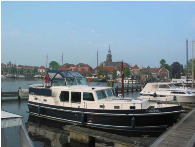
SK Koter "Prahú Heti"

Op woensdag 27 juni 2007 startten wij vanuit de thuishaven 'de Wiel' in Heusden met onze SK kotter 'Prahú Heti' van 12 meter aan een tocht, die ons via de Maas tot tot ver in Frankrijk en vervolgens via de Moesel en Rijn weer terug naar Nederland zal brengen. Onze kotter, gebouwd in 2004 door SK jachtbouw in Sneek, is geheel voor deze lange reizen ingericht.